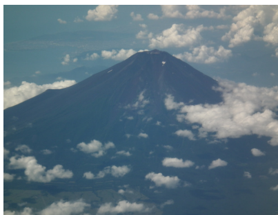
韓国行きの飛行機の機内で 見ることができる富士山。往 路は左側の席に座るのがお 勧め。