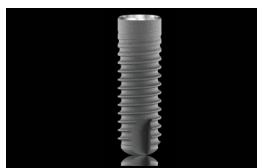
B L T インプラント